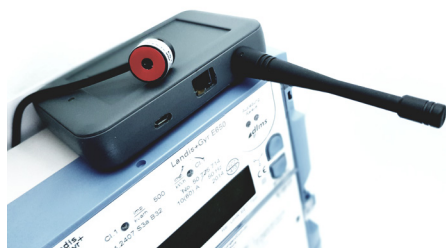
Abbildung: Fleco Node mit optischem Sensorkopf zur Auslesung von elektronischen Stromzählern

Als Ausweg bleibt die Installation von temporären Messeinrichtungen, was erhebliche Mehrkosten verursacht. Erschwerend kommt hinzu, dass die Daten oftmals erst nach Abschluss der gesamten Messperiode zur Verfügung stehen, da sie ortsgebunden aufgezeichnet werden.